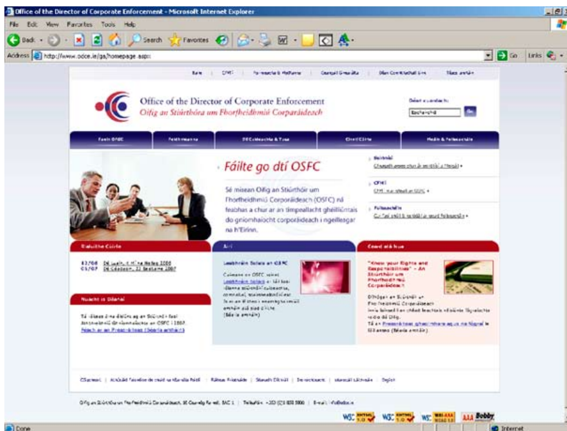
Léargas 5.3.1: Gabháil Scáileáin de Leathanach Baile Shuíomh Idirlín nua OSFC

Rinneadh uasdátú ar bhonn tráthrialta ar an suíomh i rith na bliana ar fhaisnéis maidir le hobair OSFC agus le forbairtí rialachais chorparáidigh a bhaineann léi. Ar an ábhar nua a cuireadh ar taispeáint ar an suíomh idirlín i 2007 bhí foilseacháin nua na hOifige, preasráitis agus ailt a d’eisigh an Stiúrthóir agus an fhoireann, torthaí na gCásanna Cúirte inar ionchúisigh an Stiúrthóir daoine i gcásanna ina raibh amhras faoi shárú dhlí na gcuideachtaí nó faoi shárú dualgas agus cinntí eile Cúirte a bhain le dlí na gcuideachtaí.